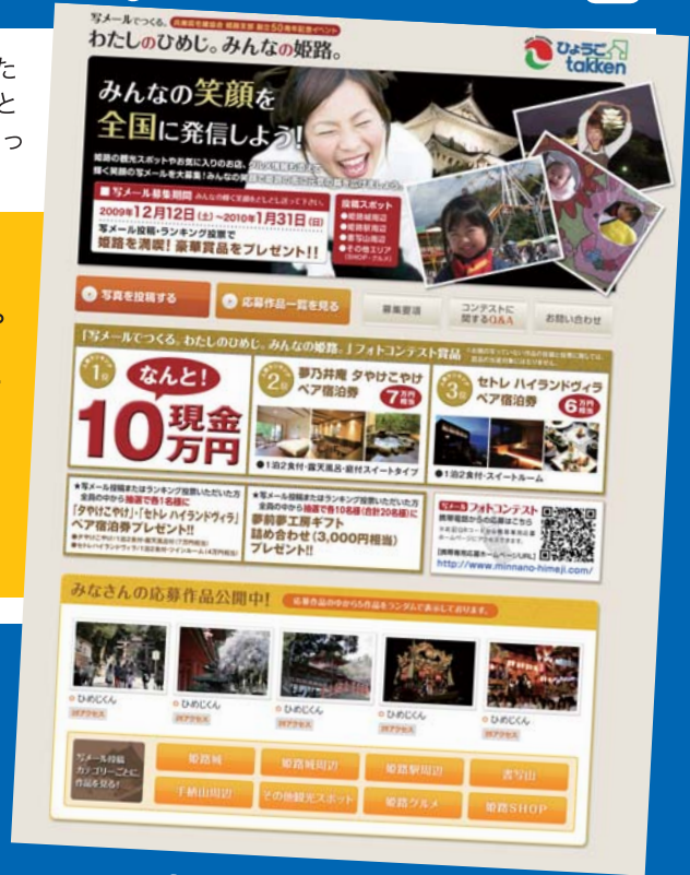
※画像はサンプルです

ランディングページは、HPとは違い1ページで完結しています。そのため、自社のHP上で特に販売促進したい商材のコーナーとしてwebページをつくり、そのページで最終的なアクション(商品購入や資料請求)まで誘導します。また、HPを更新するには費用がかかりすぎてなかなか手が付けきれない企業様にも、新商品のみの紹介としてweb上での宣伝ツールにお使いいただけます。